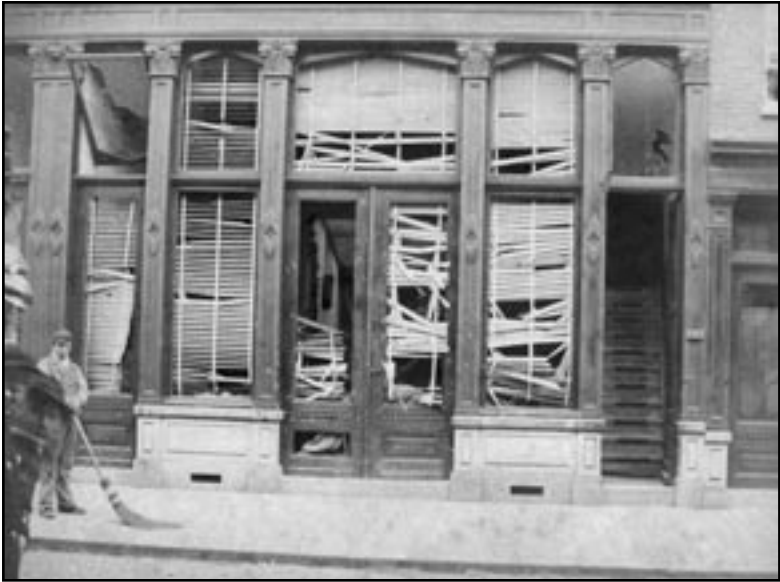
Het lokaal op de Binnenrotte, voorzijde en binnen, na de oranje furie